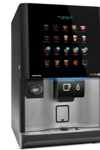
Kit de integración para sistemas cashless MDB en máquina

La máquina es compatible con Pay4Vend permitiendo el pago directamente desde el móvil.