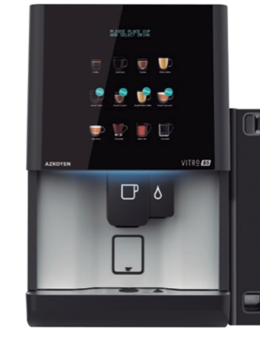
Módulo exterior para la instalación de medios de pago MDB