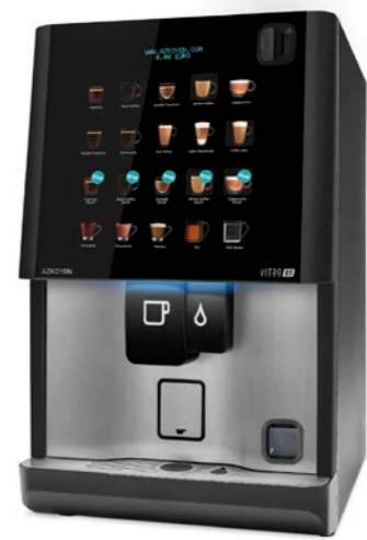
Integración para sistemas MDB de devolución de monedas en máquina